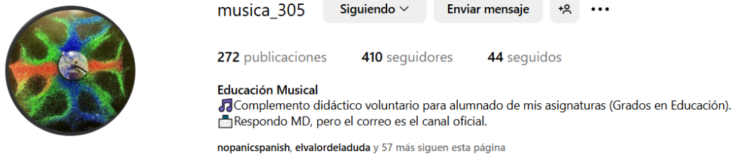
Figura 1. Interfaz de la cuenta académica creada

El motivo de que la cuenta tuviese un perfil privado se debió a que en ella se distribuían materiales didácticos elaborados exclusivamente para la asignatura y, por ende, para el alumnado matriculado en esta. El acceso de los usuarios se verificaba continuamente para confirmar que era el propio estudiante quien visualizaba las publicaciones.